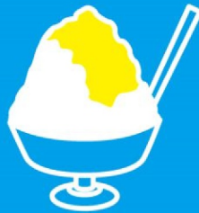
目にも涼しく 体にひんやり