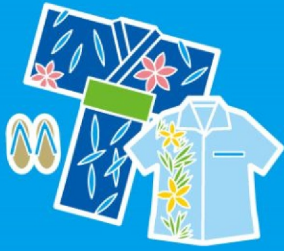
夏らしく 涼しげな服を