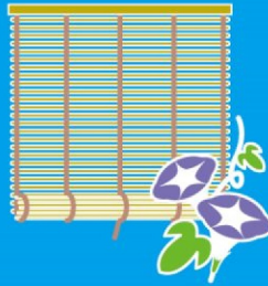
直射日光をさえぎる 伝統の知恵