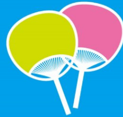
少しの風で 体感温度がちがいます