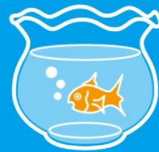
涼しげなものを お部屋にひとつ